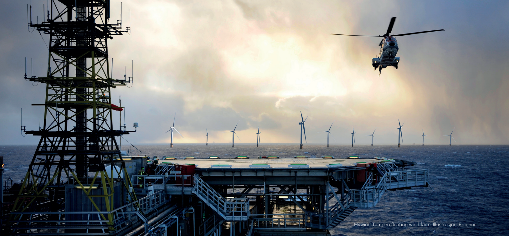
Hywind Tampen floating wind farm. Illustrasjon: Equinor